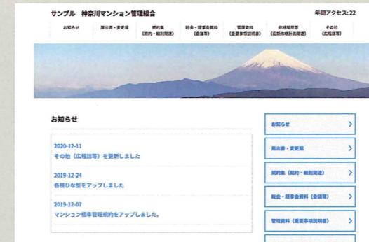
会員管理組合用ホームページ（サンプル） テンプレートを提供しています。