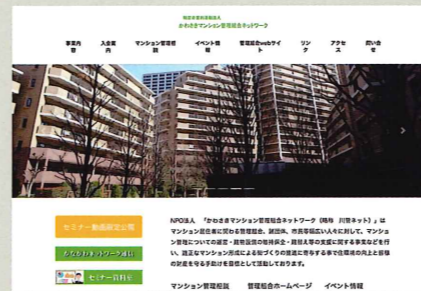
川管ネット ホームページ

また、会員管理組合のホームページの作成を支援しています。管理組合に特化したテンプレートも提供しています。