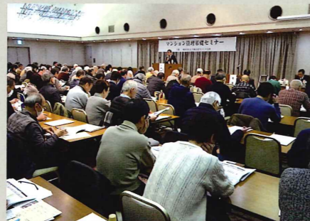
「マンション管理基礎セミナー」

フォーラムやセミナー、基礎セミナー（川崎市住宅供給公社の基礎セミナーは共催しています）、情報交換会、勉強会等開催しています。会員と賛助会員相互の情報交換会は会員のみが参加できます。