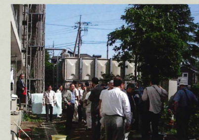
大規模修繕工事の見学会

マンションの管理運営の参考となるべく、見学会を企画しています。過去には「大規模修繕工事の見学会」などを実施しました。